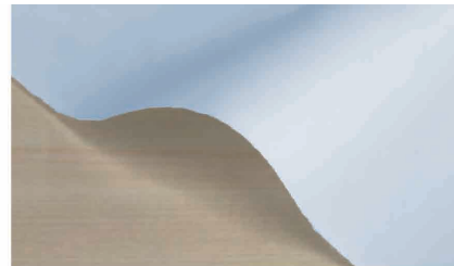
ライトブルー / light blue