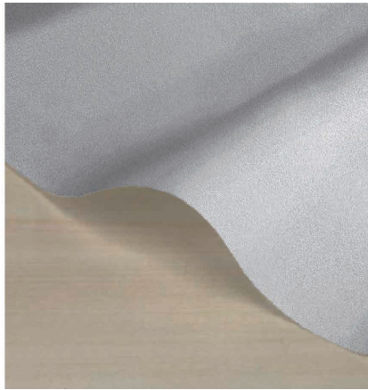
アルミタフタ /aluminum taffeta